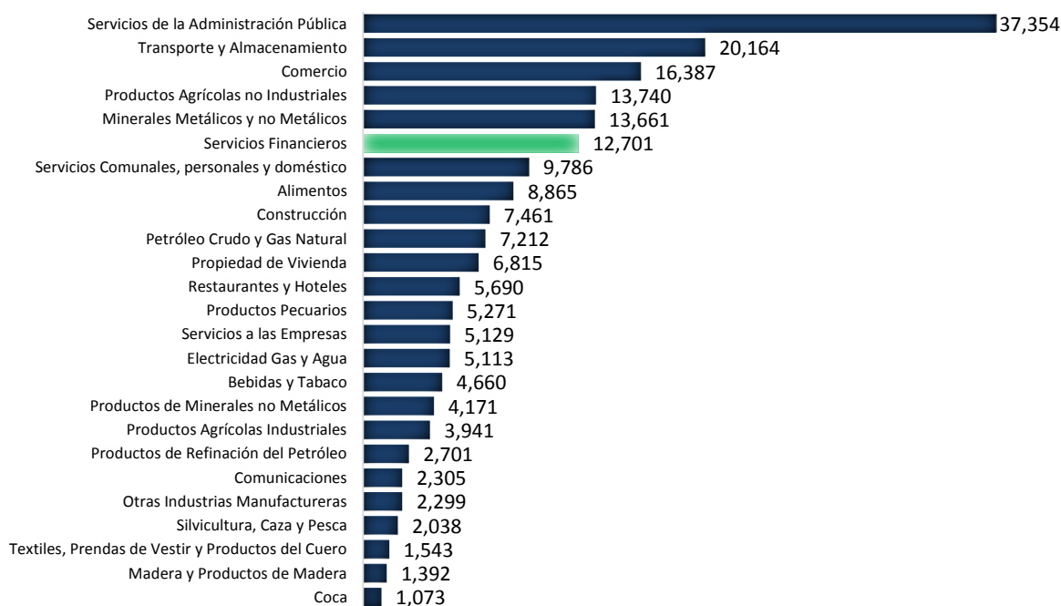
Gráfico 2 Valor agregado a precios corrientes de las actividades económicas de Bolivia, 2016 (en millones de bolivianos)